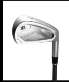
XX1 GF-216 IRON