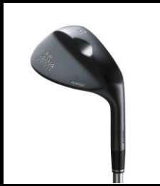
To-Be ARMA GF-208 WEDGE