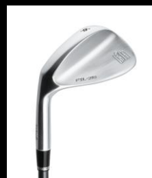
FSL-216 (Lefty) WEDGE