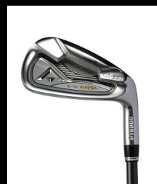
To-Be ARMA GI-220 IRON