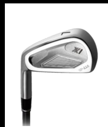
XX1 GF-216 (Lefty) IRON