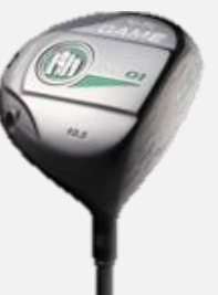
To-Be GAME LD-01 DRIVER