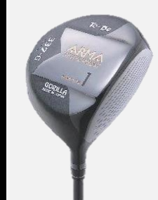
To-Be ARMA 337-S DRIVER