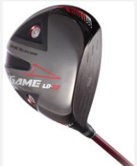
GAME LD-02 DRIVER