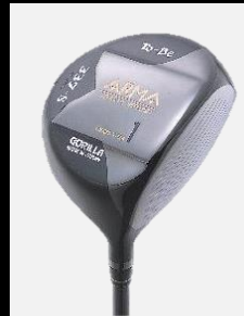
To-Be ARMA 337-G DRIVER