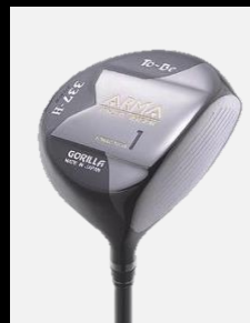
To-Be ARMA 337-H DRIVER