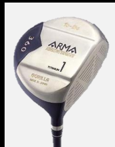
To-Be ARMA 360 DRIVER