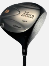
To-Be ARMA DRIVER